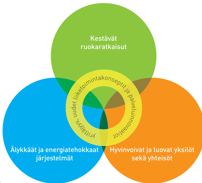
Kuva 1. Etelä-Pohjanmaa korkeakoulutoiminnan yhteiset osaamisen painoalat.

Osaamisalueiden tunnistaminen ei ole kategorista, vaan monilta osin ne menevät päällekkäin. Näillä päällekkäisillä alueilla yhdistyy monia osaamisen vahvuuksia ja ne ovat usein myös dynaamisia muutosalueita.